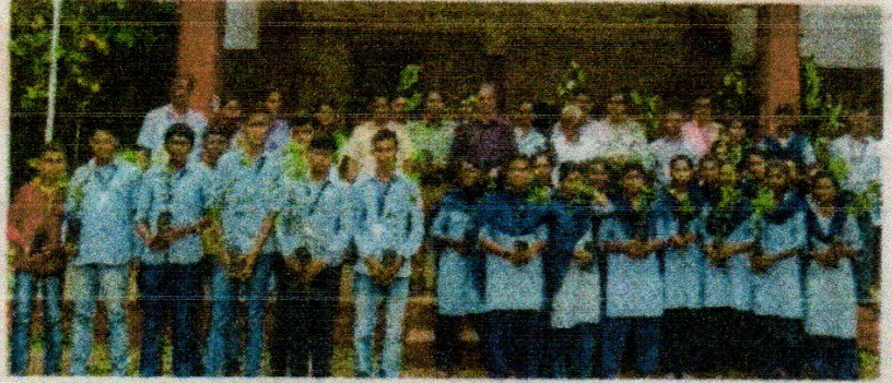
रामानंदनगर : पर्यावरण दिनानिमित्त वृक्षारोपण झाले.